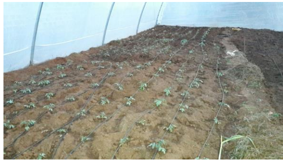
Binnen in de kas