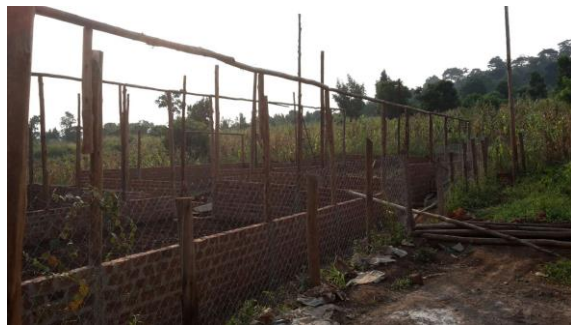
Grote kippenhok in aanbouw