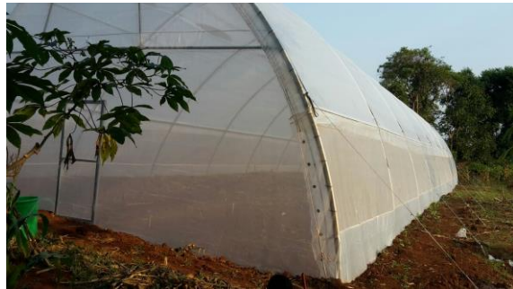
De gekochte kas