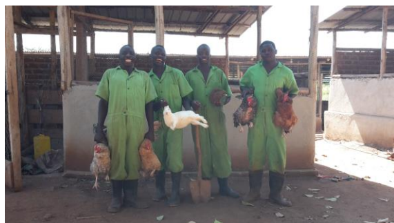
Uncles op de boerderij