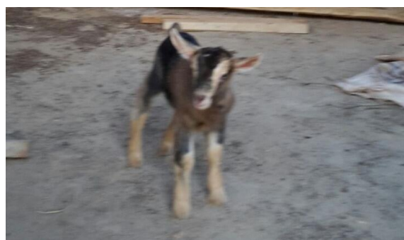
Hoera, een geitje geboren!